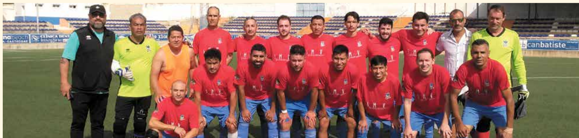
VETERANS. El Vinaròs va remuntar a la segona meitat i es va imposar en la final de la Súpercopa al R-Bitem 3-1. El partit es va disputar a l'estadi Municipal de la Devesa, de la Ràpita. D'esta forma, el Vinaròs ha guanyat els 4 trofeus de l'any. El partit va tancar la temporada. La cloenda amb la festa serà el dia 27 de juny.