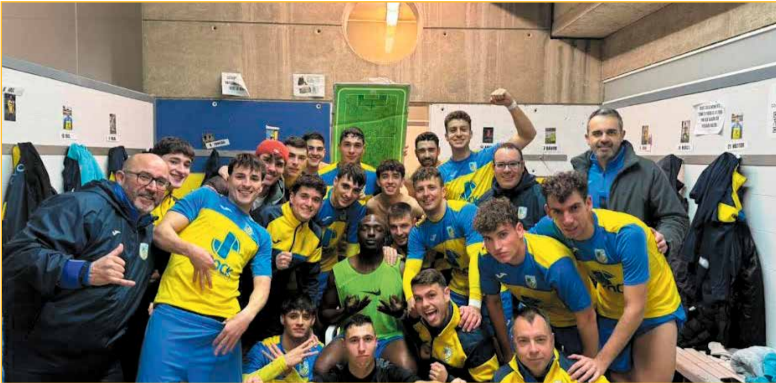
Celebracions d'una victòria després d'un partit, al vestidor de la Sènia.

Gran temporada del conjunt senienç, encara que el desenllaç va deixar un sabor agre dolç. Fins a la darrera jornada, l'equip depenia d'ell mateix per proclamar-se campió, i una victòria a Cava, en el darrer partit, li hauria donat el títol. Finalment, però, només va poder sumar un empat.