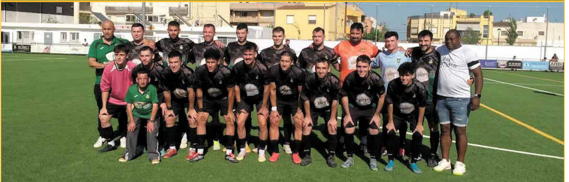
Plantilles de l'Alcanar i el Tivenys, en la final de la Copa de Quarta, disputada diumenge passat.

L'Alcanar va guanyar el Tivenys en la final de la Copa Terres de l'Ebre de Quarta (3-1). Una gran cloenda a la temporada amb un gran partit i un gran ambient amb nombrosa representació de les dues aficions.