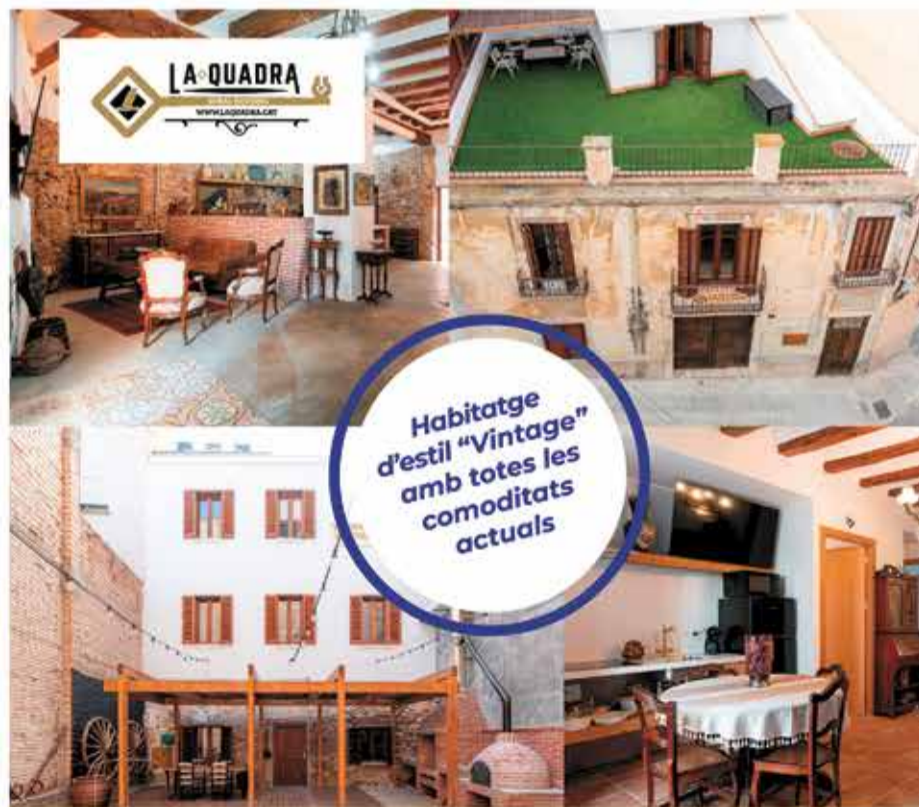
New Vil·la Vintage 2025