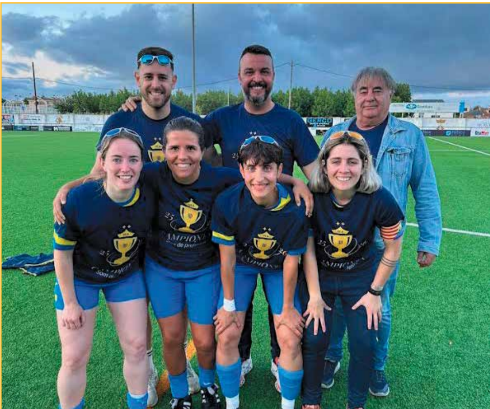
GENIS DE LA UE ALDEANA FEMENÍ, equip campió de la 1a divisió catalana