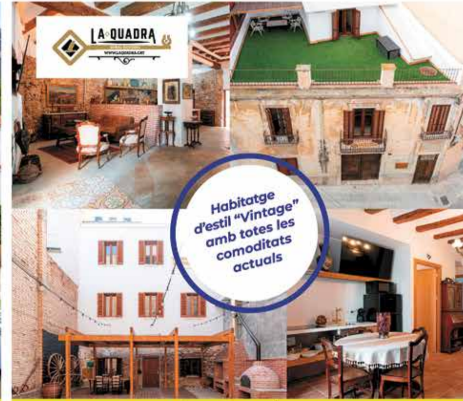
New Vil·la Vintage 2025