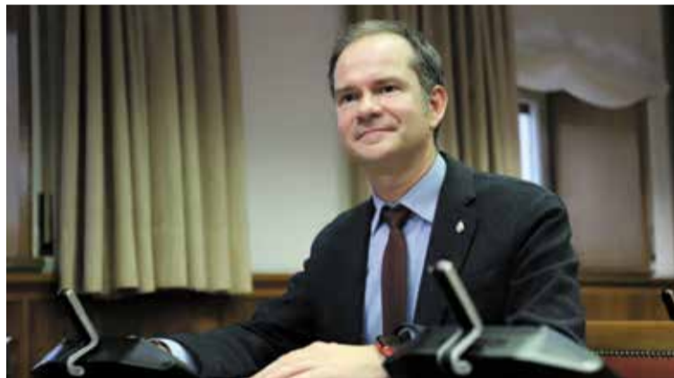
El senador socialista Manel de la Vega.

El PSC de les Terres de l'Ebre ha destacat la resposta “ràpida, contundent i sense precedents” del Govern de la Generalitat davant els danys ocasionats per la DANA Alice. Sis mesos després dels aiguats, “l'executiu ja ha mobilitzat una inversió superior als 19 milions d'euros per a la reparació d'infraestructures i la restitució de serveis essencials, amb un nivell d'execució que supera el 80 % en infraestructures rurals”. En total, “s'està actuant en 156 actuacions arreu de les Terres de l'Ebre, amb una intervenció directa en camins, barrancs i equipaments municipals afectats”. El PSC també va subratllar la importància dels ajuts directes als ens locals, que han permès donar suport a 25 municipis afectats, així com les actuacions en més de 25 quilòmetres de