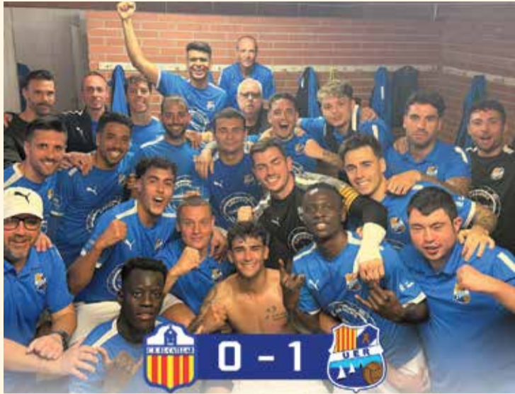
Celebracions de la UE Rapitenca, en acabar el partit al Catllar. Una gran victòria.