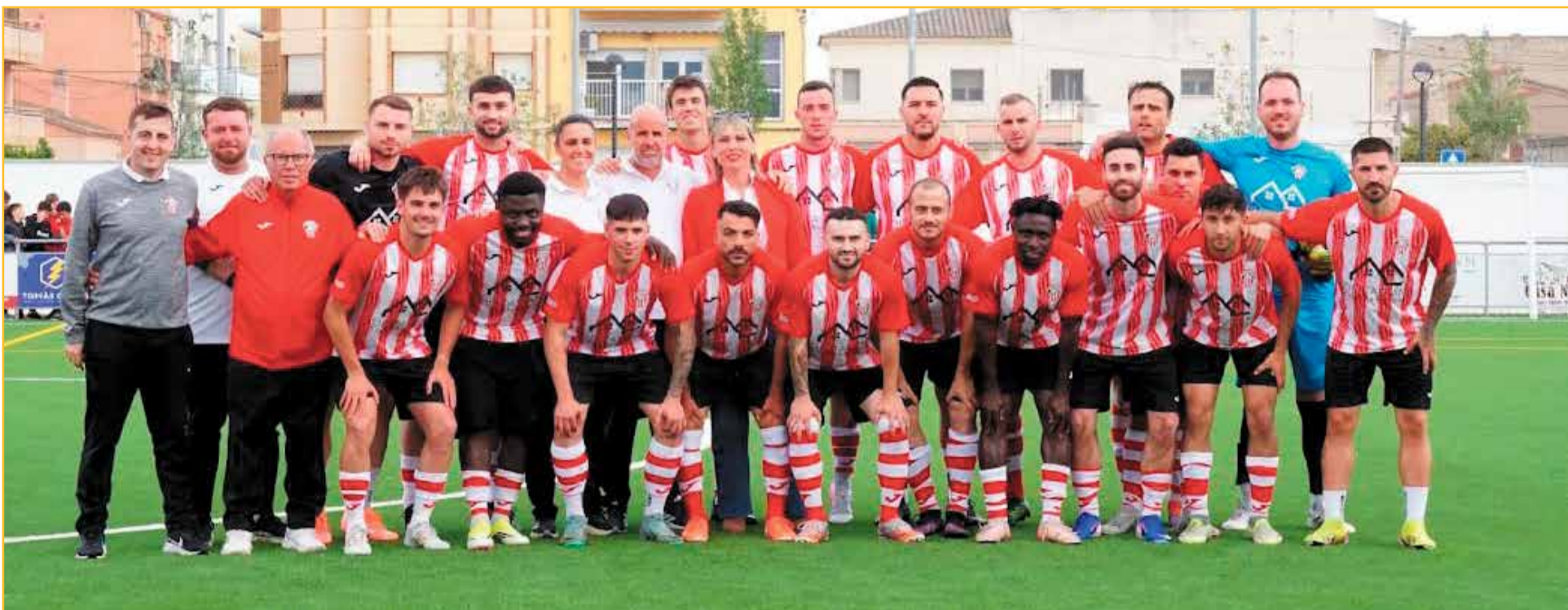
Formació del Jesús i Maria, el dia de l'estrena de la nova gespa i de les millores fetes a les instal.lacions esportives Josep Maria Torres Camp de l'Aube.