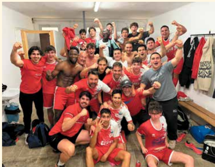
Celebracions de la UE Campredó al vestidor. L'equip suma dues victòries en dues jornades del play-off d'ascens. I demà rebrà a l'Horta.