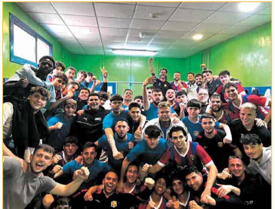
Celebracions al vestidor del Santa Bàrbara de la darrera victòria, contra el Móra la Nova (2-0).