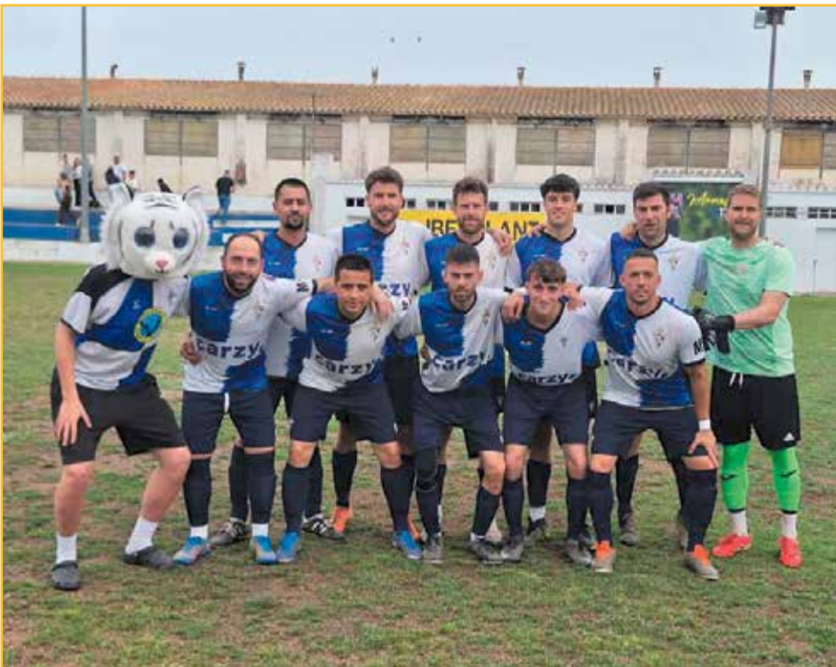
El Masdenverge va presentar dissabte la seua mascota: Barranki.