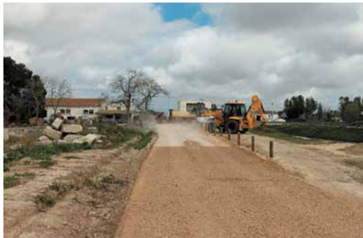
Les màquines treballant a la Via Verda de la Val de Zafán.

La Diputació ha treballat els darrers dies per enllestir els treballs a la Via Verda de la Val de Zafán, entre Roquetes i la Ràpita. Les actuacions d'aquestes setmanes han comportat el tractament superficial del ferm, la implantació de la senyalització i de sistemes intel·ligents per a la seguretat viària, així com elements del mobiliari. També s'hi han dut a terme treballs de plantació d'arbrat en diversos punts de tot el recorregut. El nou tram de la Via Verda de la Val de Zafán té uns 27 quilòmetres (practicables en bicicleta o a peu), i connectarà la via amb el litoral, enllaçant els dos parcs naturals, el dels Ports i el del Delta. La infraestructura s'obrirà al públic demà 18 d'abril, amb una festa d'inauguració per a la ciutadania.