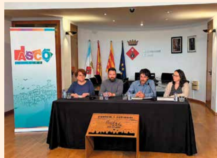
Roda de premsa, a l'Ajuntament d'Ascó.