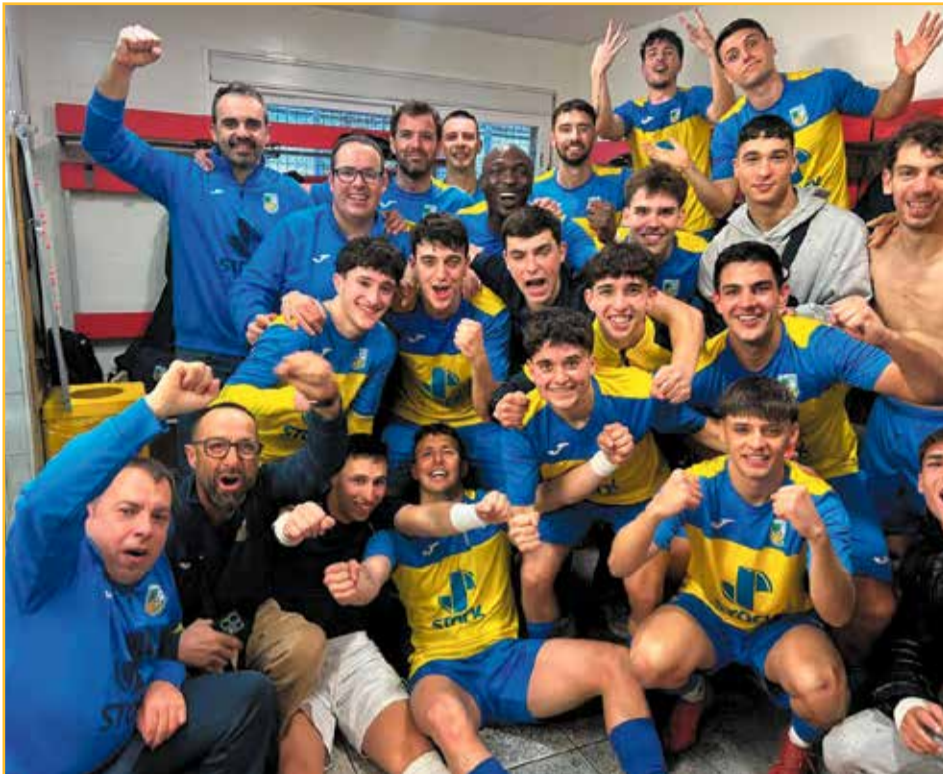
Celebració de la victòria de l'equip senienç al vestidor, a la Pobla de Mafumet (2-3)