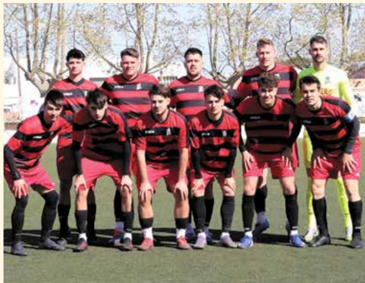
Formació del Remolins Bitem, diumenge passat a la Cava.