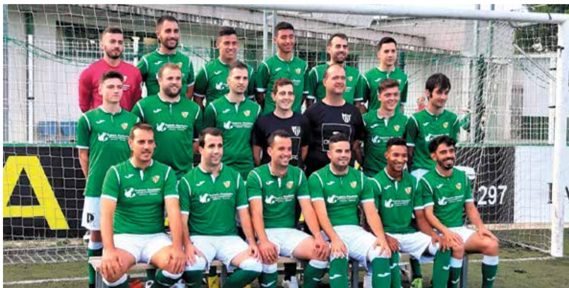
'Cata', la mascota del Catalònia. El J i Maria després de la victòria a Roquetes. I plantilla del Catalònia B.