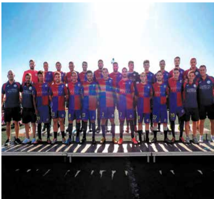
L'Ametlla de Mar va fer la presentació dels equips, dissabte passat.