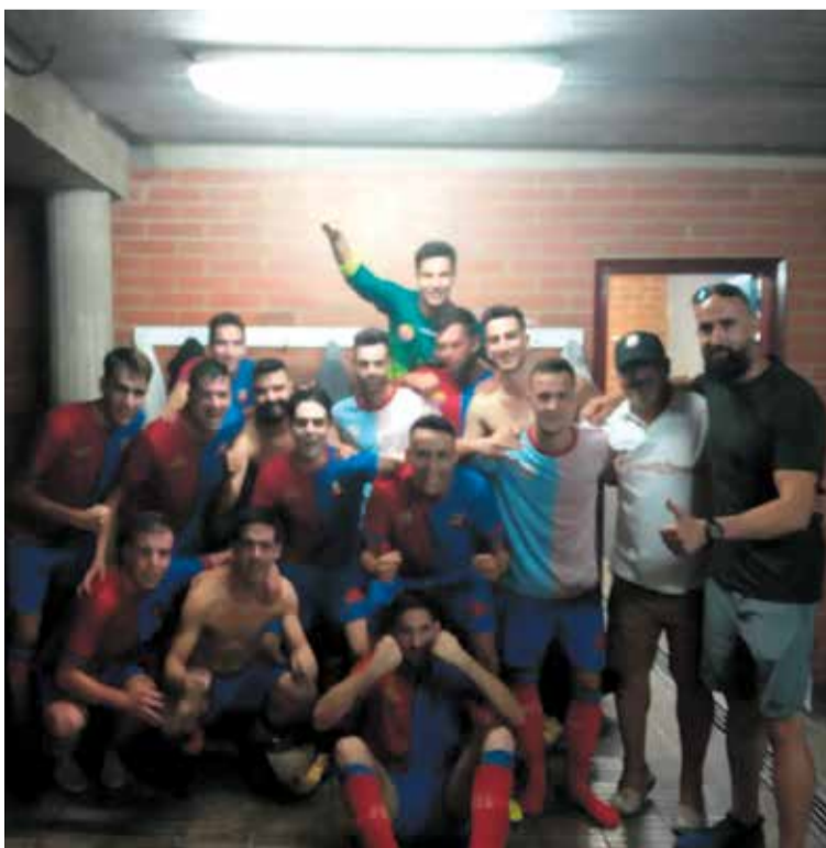
L'Alcanar, ara a Quarta, va tornar a guanyar, després de 40 jornades.