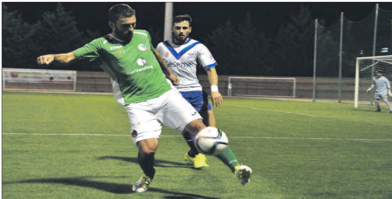
L'Ascó va empatar dimecres contra l'Europa (1-1)

L'Ascó va perdre diumenge al camp del líder i dimecres va empatar amb l'Europa