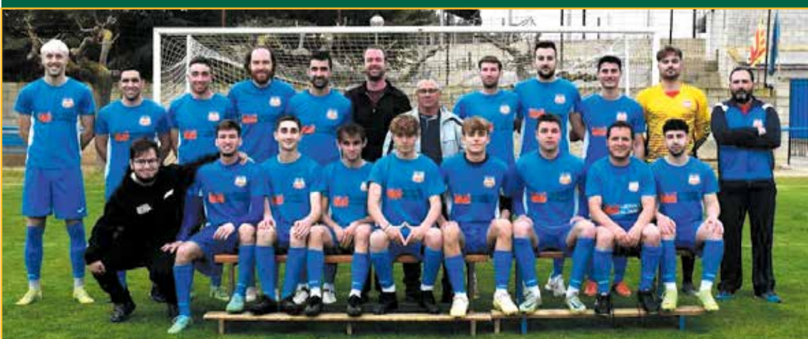
Formació del Corbera, segon classificat a Quarta catalana.