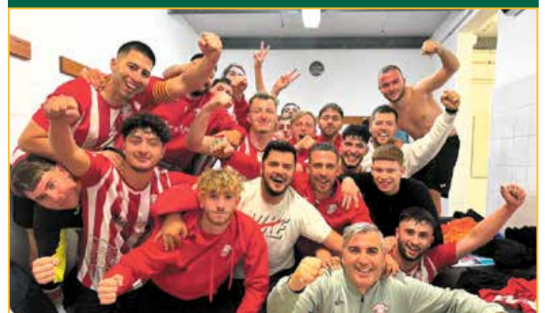
El filial de Tercera catalana del Jesús i Maria va guanyar el líder Amposta, equip que va perdre el primer partit de la lliga.