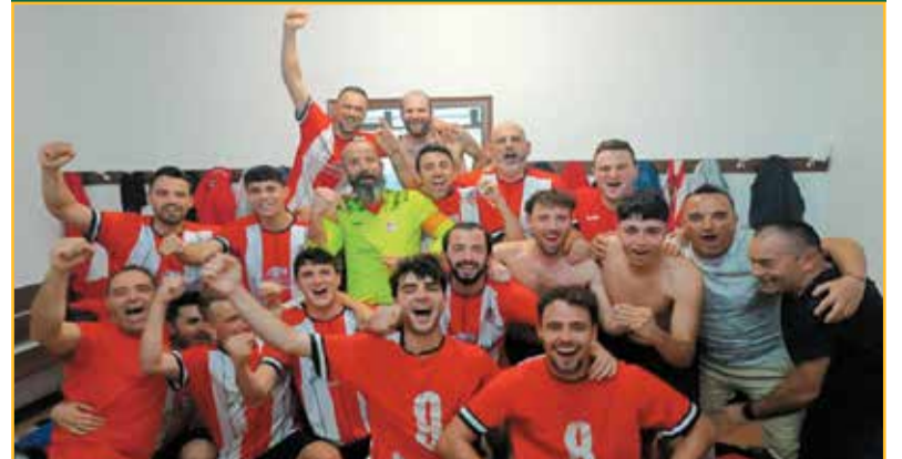
Esta temporada ha tornat el futbol a la Torre de l'Espanyol. Un punt de partida a un projecte que diumenge va tenir el premi a la perseverança, la lluita i la paciència amb el primer triomf en la lliga.