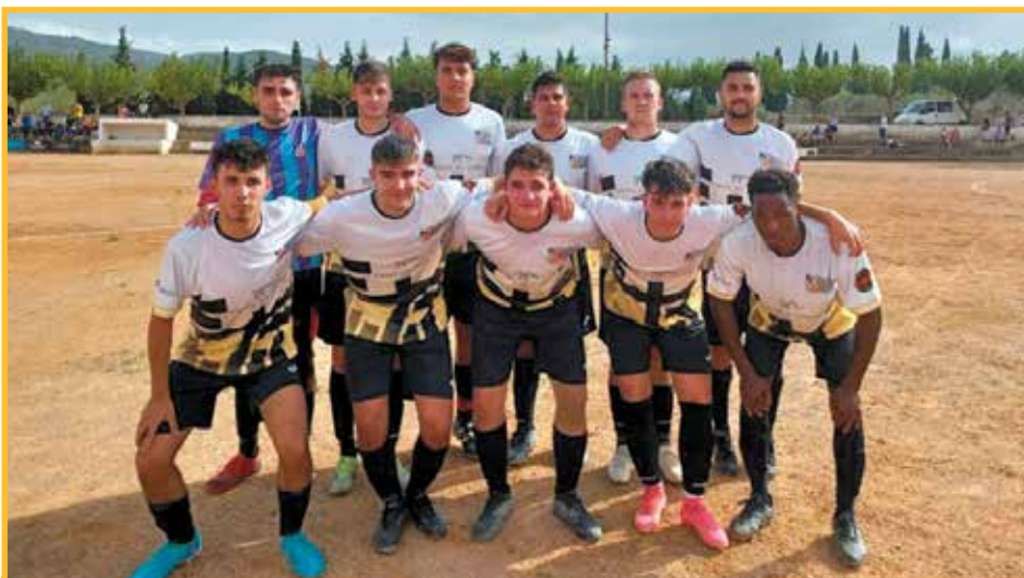
Formació de l'Horta.