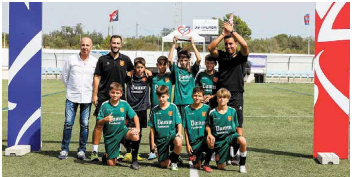
L'At de Madrid fou el guanyador d'esta edició. A la foto de baix, el CF Damm finalista.