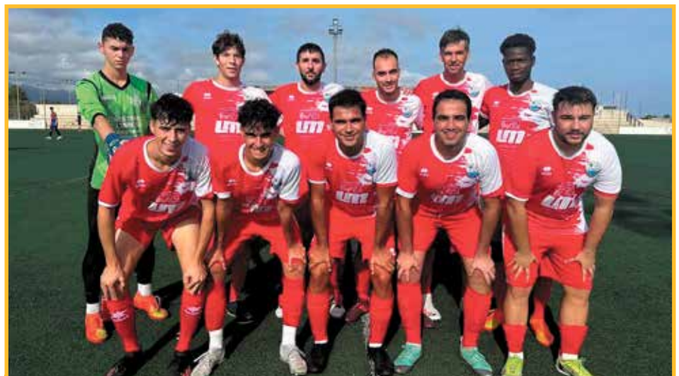
Equip del Campredó.