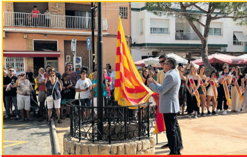
L'AMETLLA DE MAR