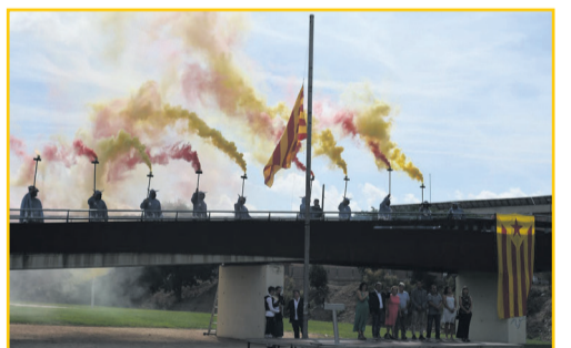
MÓRA LA NOVA