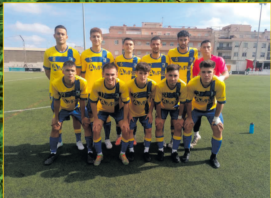
CF LA SÈNIA