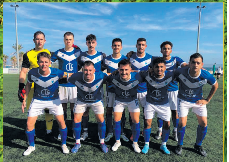
C AT MÓRA LA NOVA