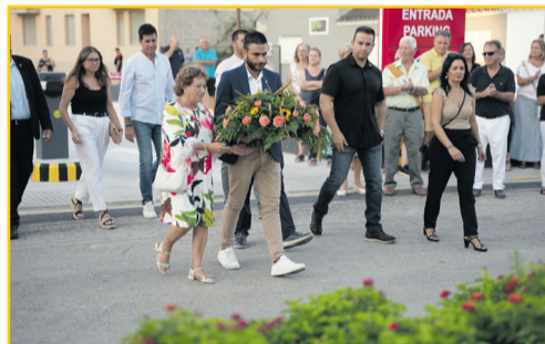
SANT JAUME D'ENVEJA