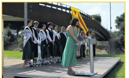
MÓRA LA NOVA