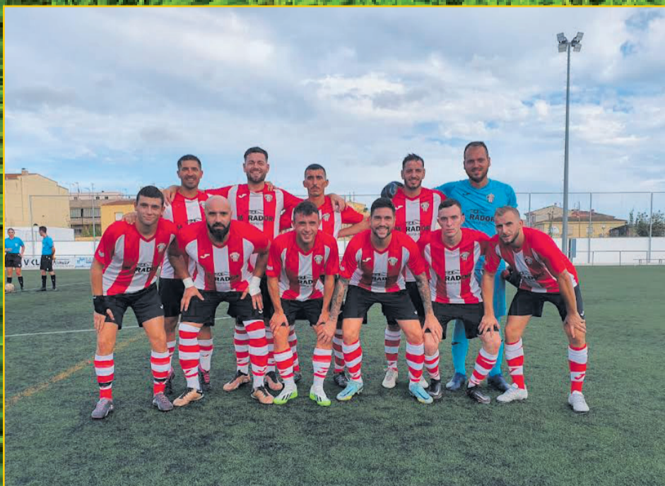
UD JESÚS I MARIA