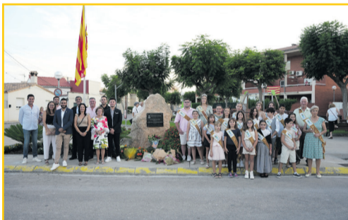
SANT JAUME D'ENVEJA