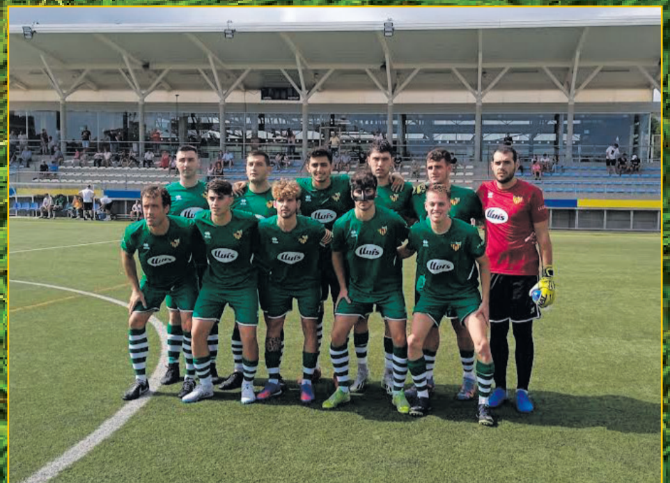
CF JESÚS CATALÒNIA