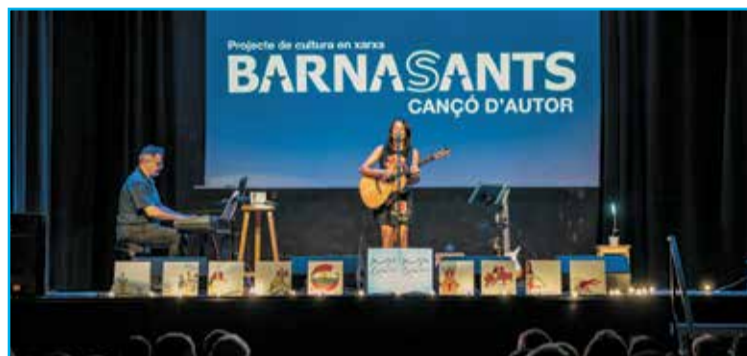
Imatge de la presentació 'Orgànic' al Barnasants.

un quadre o escrivint un llibre. Per sort, jo tinc una professió que és una eina terapèutica en sí mateixa i per tant, vehiculo tot el que dic, el que sento, el que passa al meu voltant, amb un cert accent biogràfic. Procuro que les meves cançons siguin eines per lluitar pel riu, pels trens, per la justícia social, i també per estimar, per demostrar afecte a les persones i per superar situacions i moments difícils, com ha sigut aquest que he viscut. Quan em van diagnosticar tenia clar que d'aquesta experiència en sor-