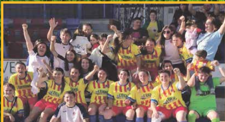
Roquetenc femení campió.