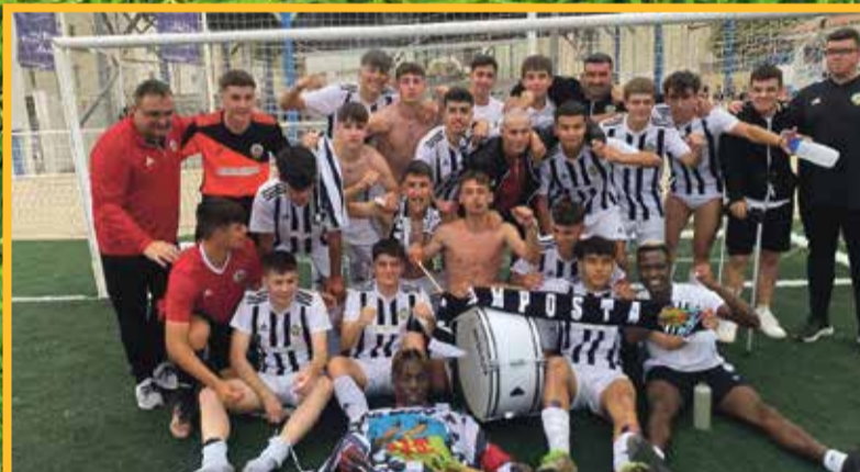
L'Amposta juvenil ha pujat a Preferent.