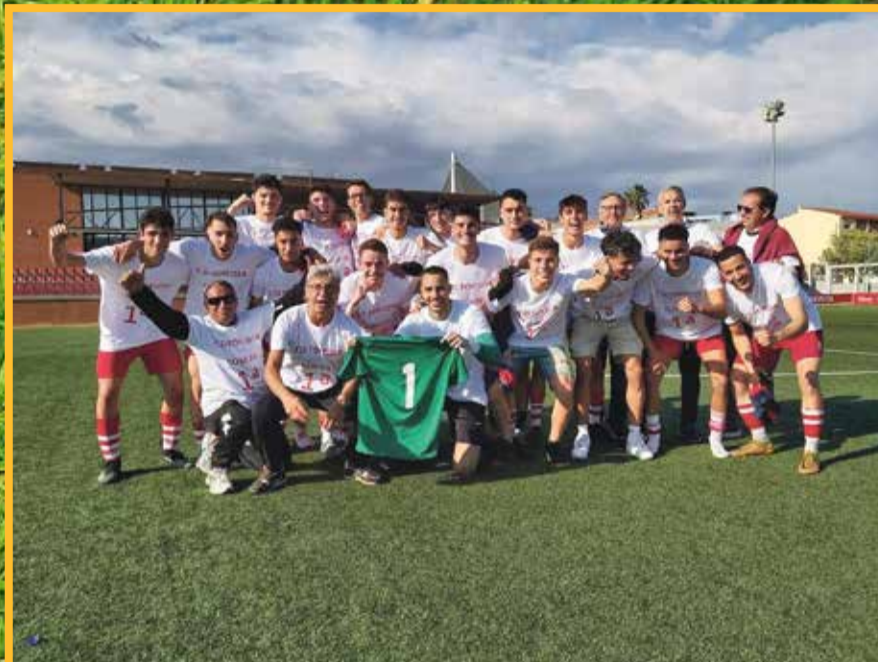
El Tortosa va celebrar l'ascens, a la Pobla.