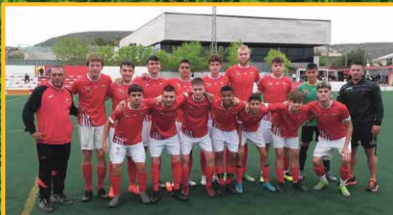
Ulldecona juvenil que esta temporada ha competit a Preferent.