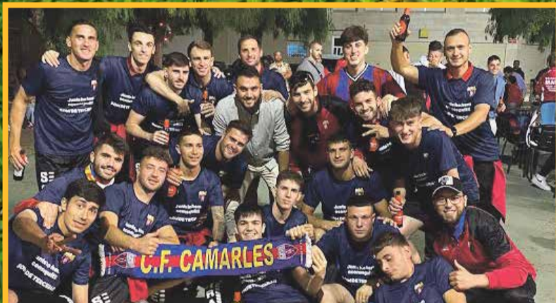
Camarles B, a Tercera.