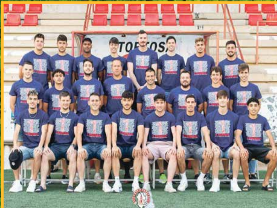
Plantilla Ascens Ebre Escola.