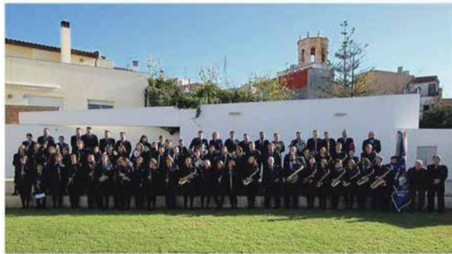
BANDA MUNICIPAL DE MÚSICA D'ALCANAR

ENTRADES Gratuïtes a l'Ajuntament d'Alcanar i a l'Oficina de Turisme de Les Cases