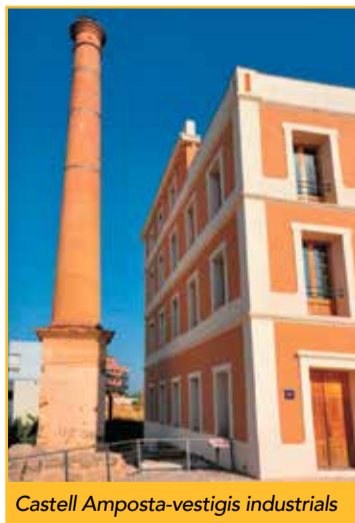
Castell Amposta-vestigis industrials

Entre el segle XIV i XV es va bastir una torre al Castell per la seua defensa, coneixem la seua totalitat per un preciós gravat fet per Moulinier per a Alexandre Laborde (s.XIX).