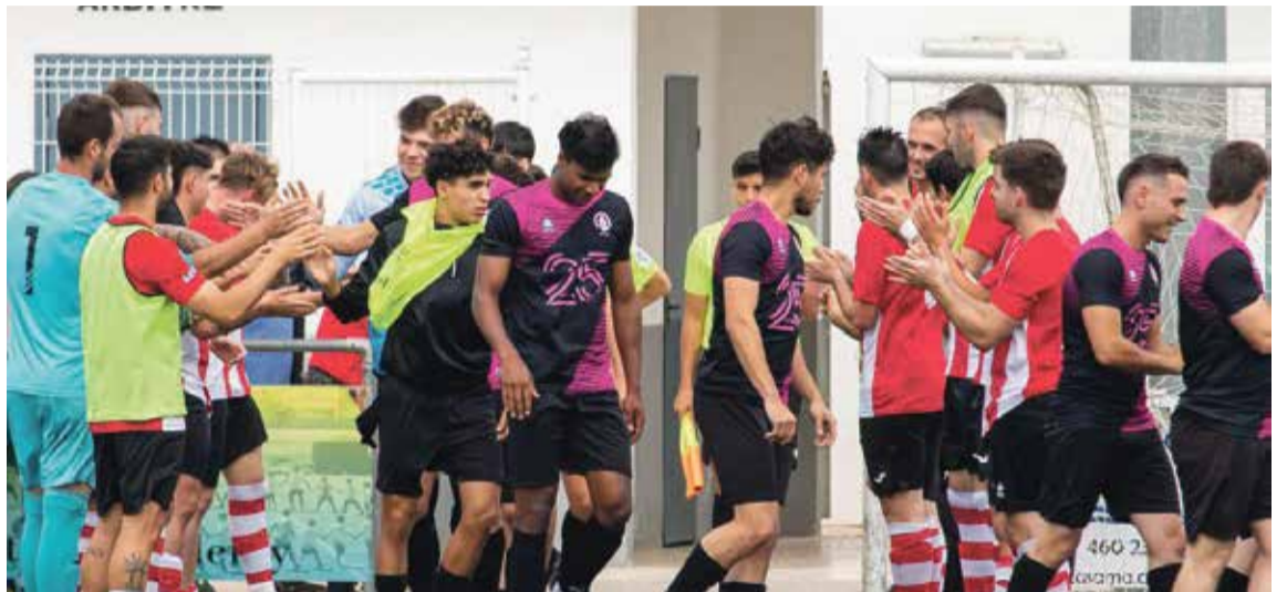
L'Ebre Escola va rebre el passadís per l'ascens, diumenge passat, a Jesús i Maria.

Ara s'obre una nova etapa, amb la fusió. Buera comentava que "a mi m'agradaria jugar amb l'Ebre Escola. Hem estat anys treballant per arribar fins aquí, quan no era l'objectiu. I ara per una qüestió pressupostària hi ha dificultats per seguir i s'ha de fer la fusió. Una fusió en la