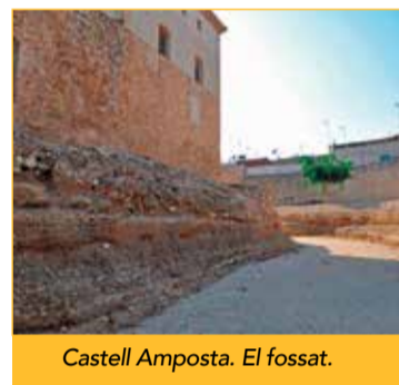
Castell Amposta. El fossat.