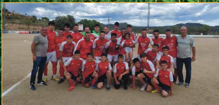
El Pinell acarona l'ascens. A la foto, amb l'aleví campió jocs escolars.