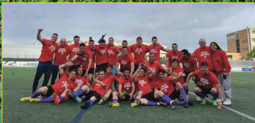
CF Gandesa, campió i ascens a Segona.