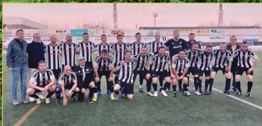
AV Amposta, campions de lliga.