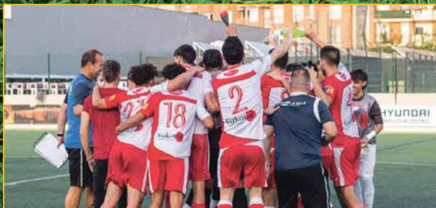
Ebre Escola ha pujat a Primera.