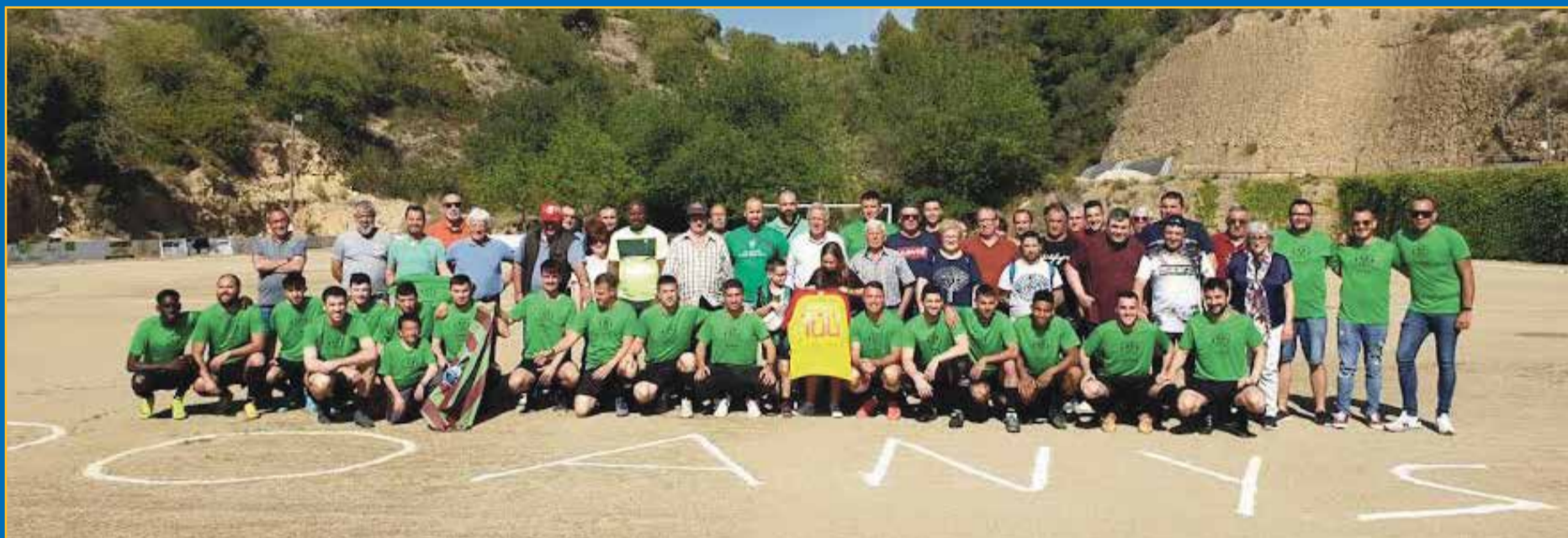
Tivenys, fa dos caps de setmana, va viure actes amb motiu del centenari de futbol al municipi.