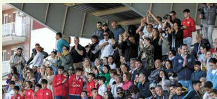
Imatges de l'ITE DV7. Inauguració a la Ràpita i cloenda a Amposta, amb David Villa.