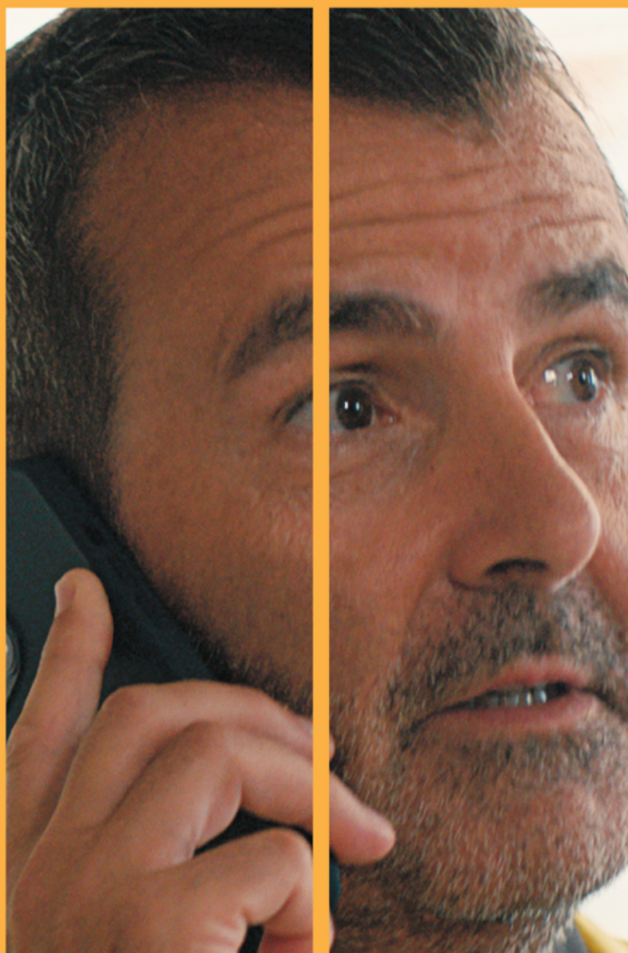
*Promoció vàlida durant 3 mesos. Després la tarifa passa a 32€ al mes. Promoció disponible subjecte a cobertura.