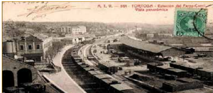
Vista panoràmica de l'estació del Ferrocarril de Tortosa.

La creació del Banc de Tortosa va lligada a un grup de persones que podríem anomenar utilitaristes, eren famílies riques de Tortosa, amb vocació de fer rendir els diners al màxim. Persones que invertiran en un pont privat, que participaran en l'imperi de l'oli, que tenien un patrimoni important