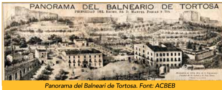
Panorama del Balneari de Tortosa.

per administrar i també productes agrícoles per vendre arreu.