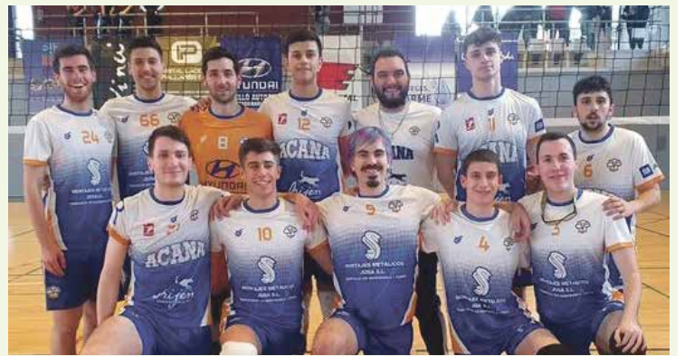
Sènior masculí B del CV Roquetes.

El sènior masculí del Club Volei Roquetes de Súperlliga 2 va guanyar 3-0, amb parcials (25-21/25-21/25-18), contra el València en el comiat davant l'afició. "L'equip va demostrar ser superior al rival amb un bon nivell i podent participar la totalitat de la plantilla. Amb aquesta victòria ens situem en una meritoria 5a posició. Cal destacar a l'afició que va omplir el pavelló i va acompanyar a l'equip com ho ha fet tota la temporada. El proper partit serà a Castelló per finalitzar la temporada contra el CV Mediterraneo". Altres resultats d'equips del club: victòria de l'infantil masculí (0-3) a la