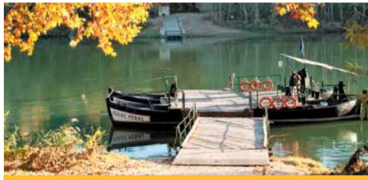
Foguet Sans, Joan. Miravet, un gran castell templer. Racó. Turismemiravet.cat

A mesura que anem caminant pel poble vell podem observar plaques de la Riuada de 1907 i la de 1787, així com escales de l'antiga drassana medieval. Pujant pel poble vell, hi trobem una portalada i un porxo on s'ubicava la porta que tancava la població, també podem trobar-hi el mirador de la Sanaqueta, i arribem als peus de l'imponent Castell de Miravet que domina el territori. Des d'allí, per als amants del senderisme, és l'inici de la ruta de muntanya i els senders de la Cameta Coixa. Hi trobarem història, paisatge i esport!