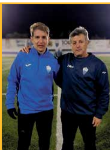
Els Giné de Móra la Nova