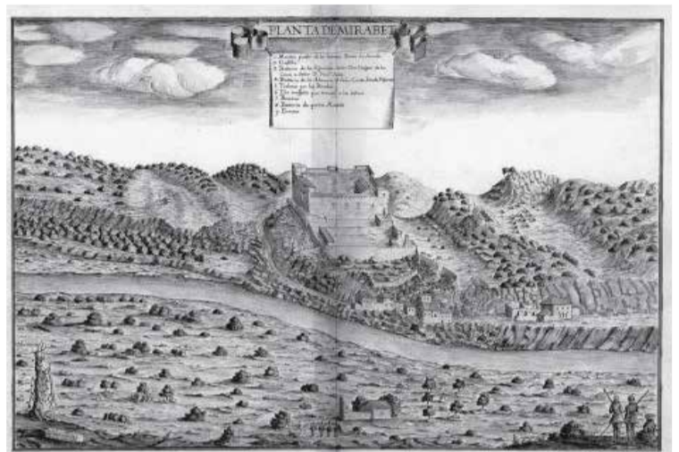
Miravet de de l'altra riba del riu. Dibuix de l'Àlbum de Heliche, segle XV. Gravet de Miravet 1650.

A finals del segle XIII el Castell era la seu de l'arxiu templari, a la Torre del Tresor es guardaven els diners de la província, i a la sala del comandador es custodiava el tresor de la casa.