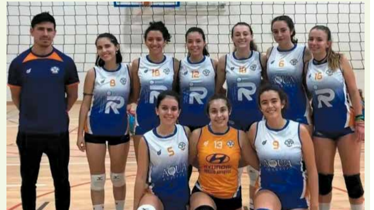
Sènior femení del CV Roquetes.

El sènior masculí del Club Volei Roquetes de Súperlliga 2 va perdre a la pista del Sant Pere i Sant Pau (3-0) amb parcials (25-18/25-21/25-16). "Partit en el que l'equip no va poder puntuar davant un rival que va demostrar ser un dels candidats a jugar la fase d'ascens". El proper partit, el Volei Roquetes rebrà el Club Voleibol Sayre Mayser de Gran Canària. Altres resultats del cap de setmana passat: victòria del juvenil femení (1-3) contra l'AEE Institut Dolors Mallafrè. Per la seua part, també contra Institut Dolors Mallafrè derrota