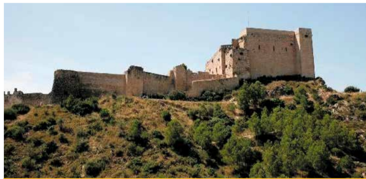
Castell de Miravet

L'Església Vella és un edifici renaixentista construït entre els segles XVI i XVII pels hospitalaris, conté una taula de pedra feta pels templers al segle XII que era del castell i va ser integrada a l'església el 1750. L'església, durant la guerra civil espanyola, va ser saquejada i diversos retaules foren cremats, també una bomba va caure travessant la cúpula però no va esclatar. Els devots en diuen miracle. Ubicada al centre del poble vell, actualment s'ha convertit en un monument cultural, on se realitzen exposicions, concerts, presentacions de llibres i altres actes.