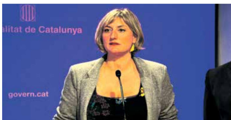
La consellera de Salut, Alba Vergés.

“Continuarà segur”, alhora que ha apuntat que s'allargaria quinze dies més. De la mateixa manera, ha afirmat que miraran “de quina manera es prorroguen” les altres mesures. En ser preguntada sobre la possibilitat d'una obertura parcial de la restauració, per exemple les terrasses, no ho ha descartat però ha alertat que “no es pot córrer”. D'altra banda, ha augurat un Nadal “molt complicat” pel que fa a la situació epidemiològica. En aquest sentit, ha dit que els grans dinars s'hauran d'evitar