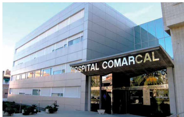
tament amb Salut, establiran d'implementar al centre de la quines mesures exactes s'han capital del Montsià.

planta. Els resultats es prevenen tenir entre diumenge i dilluns. Mentre no arribin i no es disposi de la fotografia real de la situació, l'Hospital ha suspès els ingressos de pacients negatius en covid (sí que es poden ingressar, a la planta covid, pacients positius que ho requereixin) i també totes les intervencions quirúrgiques que suposin ingrés a planta (sí que continuarà fent intervencions que no requereixin d'hospitalització). Un cop es tinguin els resultats del cribratge, l'Hospital, jun-