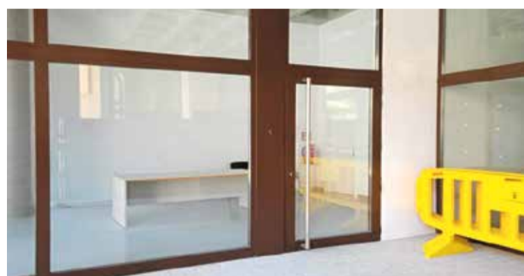
fer les classes amb seguretat o habilitar-la com a hospital en l'antiga residència d'avis per a cas necessari.

feina dels professionals de la Salut en la campanya de vacunacions en la situació actual de pandèmia. "És la nostra responsabilitat com a administració local facilitar tot allò que puguem", ha afegit, tot recordant que aquest no és l'únic espai municipal que s'han cedit per poder fer front a les necessitats derivades de la gestió de la covid-19. Per exemple, s'ha cedit un espai de l'Oficina de Turisme a l'Escola d'Apasa per a poder