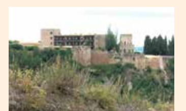
el Museu i edificacions modernistes de Tortosa.

tosa, en el marc dels actes previs de la Capital de la Cultura Catalana 2021. Serà dissabte 10 al matí, al Museu de Tortosa. Els set tresors corresponen a: la Suda i les muralles i fortificacions de la ciutat; la Festa del Renaixement; la catedral; el riu Ebre i la navegació fluvial; els Reials Col·legis; la Banda Municipal de Música; i