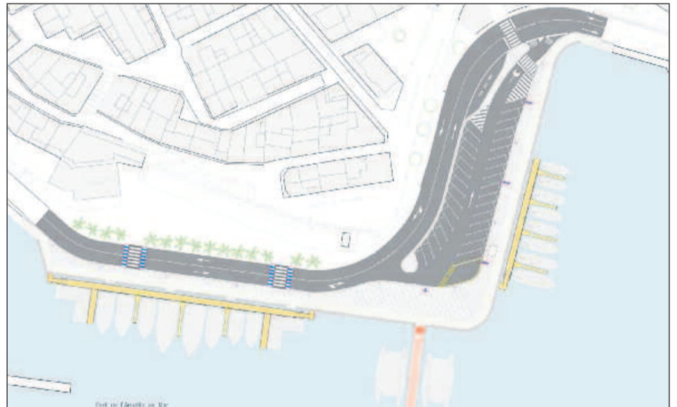
Construcció nou passeig marítim i dos pantanans flotants per als sectors pesquer i nàutic.

Al moll de ribera, es col·locaran dos pantanans flotants, un per acollir les noves activitats nàutiques i, l'altre per ubicar embarcacions d'arts menors, amb l'objectiu d'optimitzar la dàrsena pesquera. Després, l'espai de ribera es pavimentarà, se senyalarà i es dotarà de mobiliari urbà.