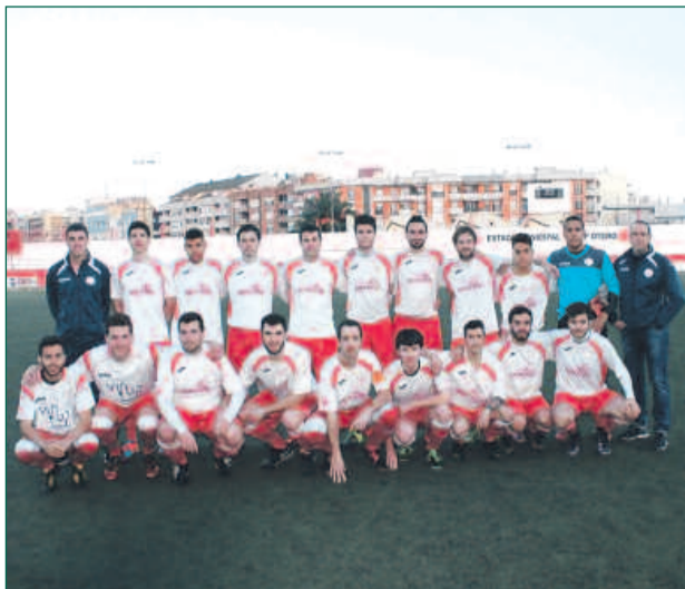
Una formació de l'Ebre Escola, d'aquesta temporada.