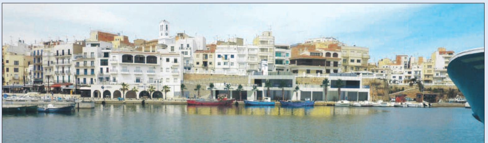
Tres miradors a nivell dels carrers del Sol, Miranda i Punta Bugarró.