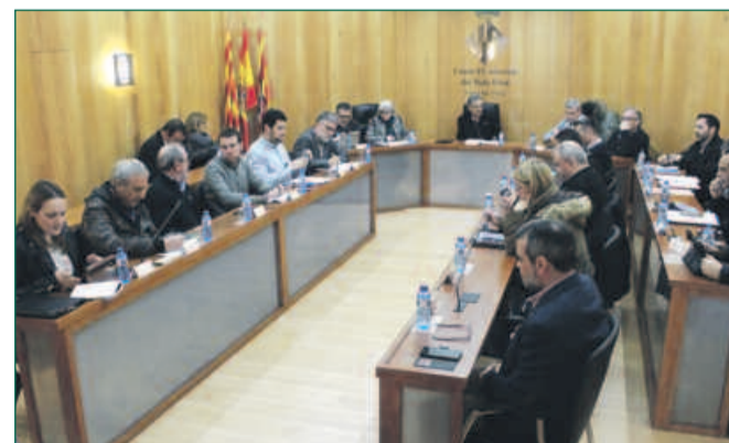
▶ Ple del Consell Comarcal del Baix Ebre.

El ple del Consell Comarcal del Baix Ebre ha aprovat les bases reguladores per a la creació de les borses de treball d'administratius i de tècnics de l'àrea d'activació econòmica i programes d'ocupació. L'objectiu és disposar de candidats per a cobrir, en règim de contractació laboral temporal, els llocs de treball vacants i substitucions necessàries per a la prestació dels serveis esmentats. D'altra banda, el plenari també ha donat llum verda al conveni de col·laboració amb el Centre Associat de la UNED a Tortosa per fomentar l'accés a la cultura i el coneixement de les persones majors de 55 anys. L'ens comarcal becarà els alumnes d'UNED Sènior per contribuir a finançar el cost de la matrícula i, a la vegada, cedirà els espais propis de la institució per a les activitats relacionades amb aquesta iniciativa o amb l'activitat general del centre associat de la UNED a Tortosa.