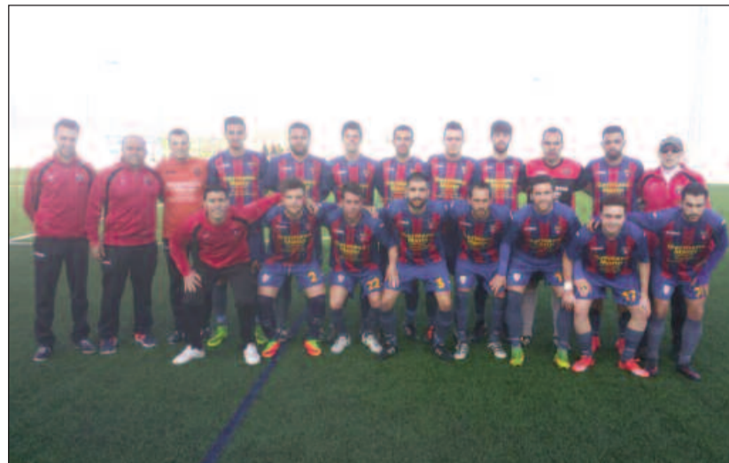
Una formació del Camarles, d'aquesta temporada.