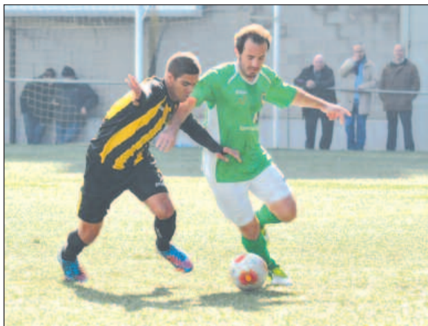
L'Ascó va empatar al camp de la Muntanyesa, diumenge.